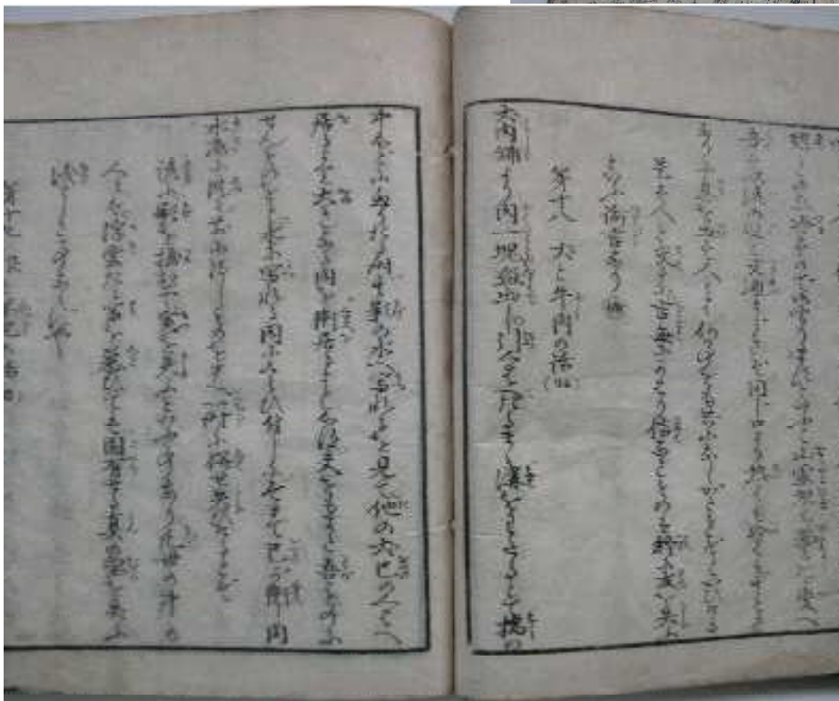
第十八 犬と牛肉の話 犬肉舗より肉一塊盗出し…